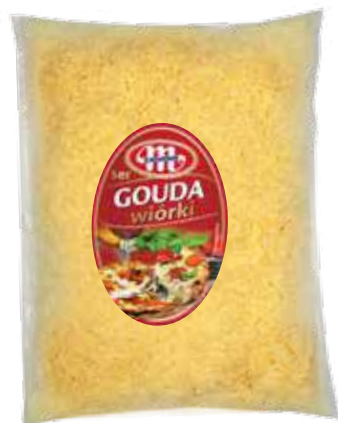
Ser Gouda wiórki

1 kg/kr 5900512111209 5900512132198 04062000