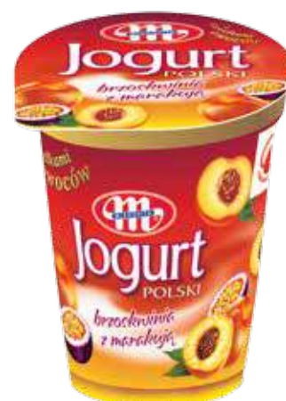
Jogurt POLSKI brzoskwinia z maramaką 350 g Peach with passionfruit yoghurt 350 g Йогурт персик и маракуя 350 г