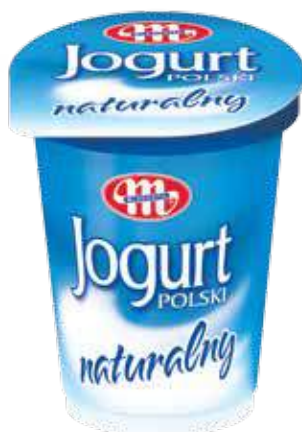
Jogurt POLSKI naturalny 350 g Natural yoghurt 350 g Натуральный йогурт 350 г

New product Mlekovita is addressed to a wide range of consumers, it is excellent for direct consumption and recommended, among others, in addition to cereal, fruit or cold dessert component. Available in the economic portion of 350 g practical and convenient cup, in one of the most popular among consumers weights. Additionally, attractive, fresh graphics, consistent with the line of yogurts Polish attracts the attention of customers.