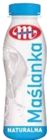
Maślanka naturalna 400 g Natural buttermilk 400 g Пахта натуральная 400 г