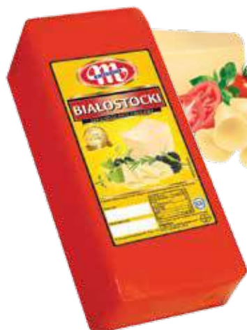
Ser Białostocki Białostocki cheese Сыр Белостоцкий

Dutch type cheeses / Сыры голландского типа