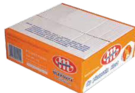
Tłuszcz roślinny do pieczenia 70% tł. 5 kg Vegetable fat for baking 70% fat 5 kg Жир растительный для выпечки 70% жира 5 кг