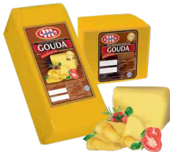
Ser Gouda wędzona Gouda smoked cheese Сыр Гауда копченая

Kod wagowy lub cenowy Code weight or price Код весовой или ценовой