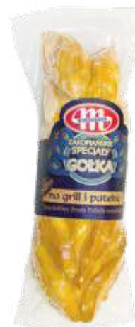
Ser Gołka Zakopiańska wędzona 400 g Gołka Zakopiańska smoked cheese 400 g Сыр Голка Закопанская копченая 400 г 5900512900292 5900512960166 04069099