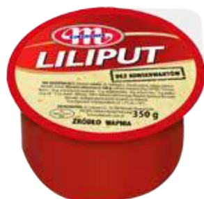
Ser Liliput 350 g Liliput cheese 350 g Сыр Liliput 350 г