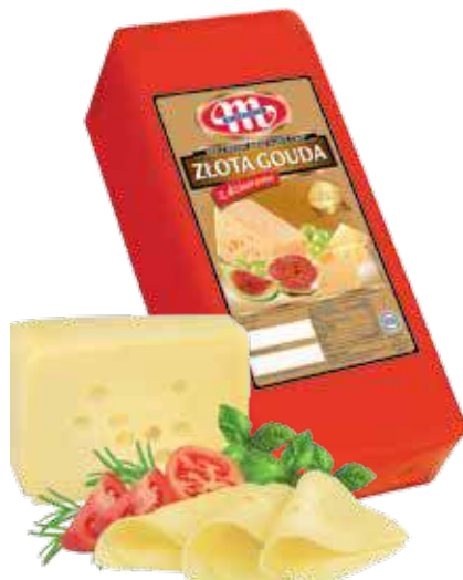
Ser Złota Gouda z dziurami Złota Gouda with holes cheese Сыр Золотая Гауда с дырками

Kod wagowy lub cenowy Code weight or price Код весовой или ценовой