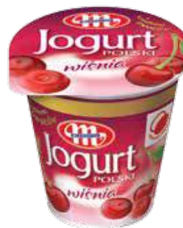
Jogurt POLSKI wiśnia 150 g Cherry yoghurt 150 g Йогурт вишня 150 г