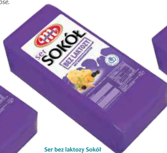
Ser bez laktozy Sokół Sokół cheese lactose free Сыр без лактозы Сокол Kod wagowy lub cenowy Code weight or price Код весовой или ценовой 04069089