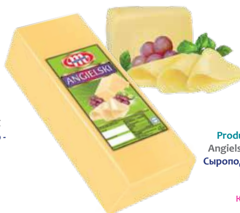
Produkt seropodobny Angielski Angielski cheese with vegetable fat Сыроподобный продукт Английский

Kod wagowy lub cenowy Code weight or price Код весовой или ценовой