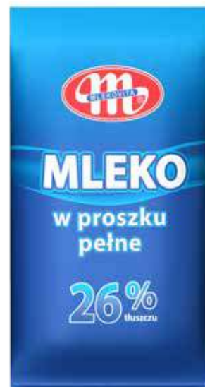
Mleko w proszku pełne (folia alum.) 500 g Full cream milk powder (alum. foil) 500 g Сухое цельное молоко (алюминиевая фольга) 500 г