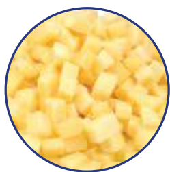
KOSTKA / GRYS 4 x 4 mm