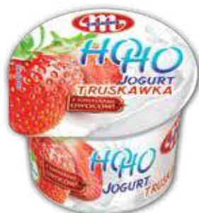
Jogurt HOHO truskawka 100 g Strawberry yoghurt HOHO 100 g Йогурт ХОХО клубника 100 г