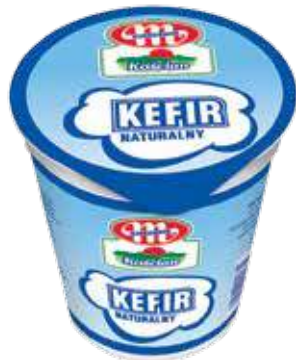
Kefir naturalny 400 g Natural kefir 400 g Кефир натуральный 400 г