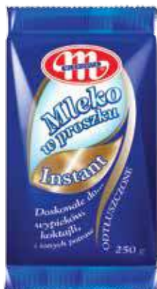
Mleko odtłuszczone w proszku instant 250 g Skimmed milk powder instant 250 g Сухое обезжиренное молоко быстрорастворимое 250 г