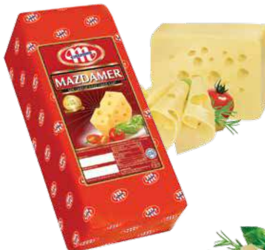
Ser Mazdamer Mazdamer cheese Сыр Маздамер Kod wagowy lub cenowy Code weight or price Код весовой или ценовой