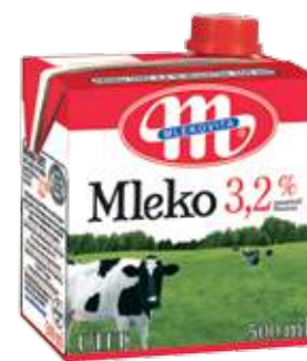
Mleko UHT 3,2% tł. 500 ml UHT Milk 3,2% fat 500 ml Молоко УВТ 3,2% жира 500 мл 5900512990354 5900512991337 04012091