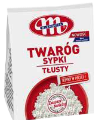
Twaróg sypki tłusty 500 g Full-fat cottage grainy cheese 500 g Творог зернистый жирный 500 г