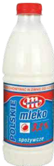
Mleko spożywcze POLSKIE 3,2% tł. 1 L Milk 3,2% fat 1 L Молоко 3,2% жира 1 л 5900512850016 5900512851013 04012091