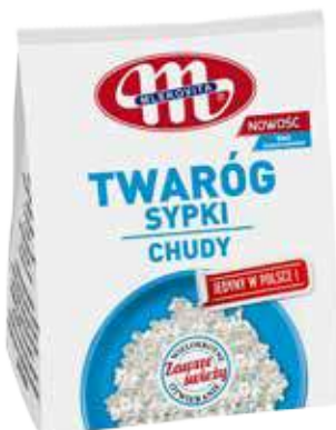
Twaróg sypki chudy 500 g Skimmed cottage grainy cheese 500 g Творог зернистый обезжиренный 500 г

Cottage grainy cheese is the only one product available in Poland. Innovative, served in a modern grainy form is dedicated to all of those who value comfort, taste and the highest quality. Thanks to the natural, wholesome and easily digestible protein, which is an important nutrient and energy source, it contributes to the growth and maintenance of muscle mass and healthy bones. Such form allows to the variety of culinary uses – cottage grainy cheese is perfect for the pastes and dressings, snacks, sandwiches, salads, dumplings, pancakes, pastas, cakes and cookies.