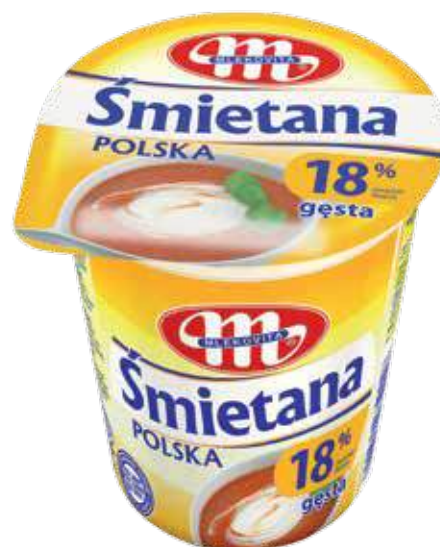
Śmietana POLSKA 18% tł. 400 g Sour cream 18% fat 400 g Сметана 18% жира 400 г 5900512350028 5900512351032 04039059