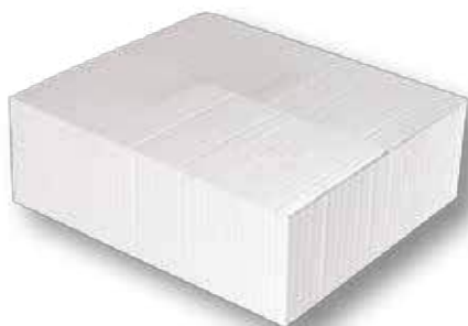
Margaryna piekarnicza 80% tł. 5 kg Baking margarine 80% fat 5 kg Маргарин для выпечки 80% жира 5 кг