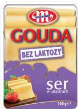
Ser bez laktozy Gouda 150 g Gouda cheese lactose free 150 g Сыр без лактозы Гауда 150 g 5900512999814 5900512992938 04069078