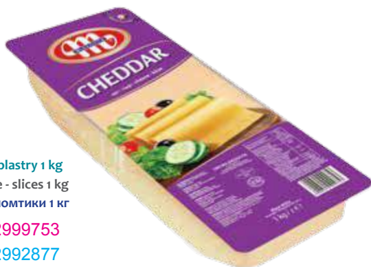
Ser Cheddar - plastry 1 kg Cheddar cheese - slices 1 kg Сыр Чеддер - ломтики 1 кг