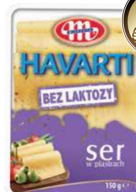
Ser bez laktozy Havarti 150 g Havarti cheese lactose free 150 g Сыр без лактозы Хаварти 150 g 5900512999838 5900512992952 04069076