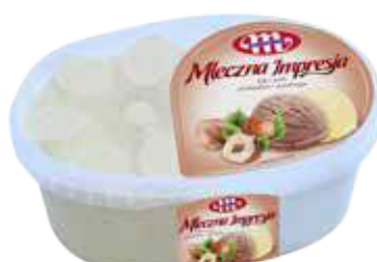
Lody Mleczna Impresja o smaku śmietankowo-orzechowym 1 L Mleczna Impresja flavour cream-hazelnut ice cream 1 L Мороженое сливочно-ореховое 1 Л