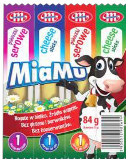
Paluszki serowe 84 g Cheese sticks 84 g Сырные палочки 84 г

The offer is complemented by cheese sticks with black potatoes and smoked cheese sticks.