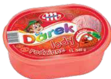
Lody rodzinne o smaku truskawkowym 1 L Family strawberry ice cream 1 L Клубничное семейное мороженое 1 Л