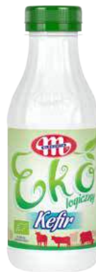
Kefir ekologiczny 375 g Ecological kefir 375 g Кефир экологический 375 г