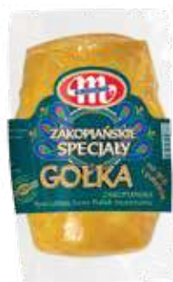
Ser Gołka Zakopiańska wędzona 135 g Gołka Zakopiańska smoked cheese 135 g Сыр Голка Закопанская копченая 135 г 5900512900070 5900512910079 04069099