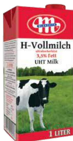
Mleko UHT 3,5% tł. 1 L UHT Milk 3,5% fat 1 L Молоко УВТ 3,5% жира 1 л 5900512990262 04012091