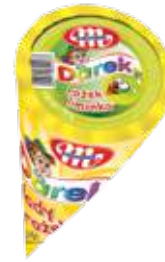
Rożki o smaku limonkowym 120 ml Limon ice cream cones 120 ml Лимонный рожок 120 мл