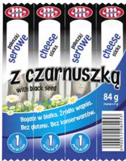
Paluszki serowe z czarnuszką 84 g Cheese sticks with black seed 84 g Сырные палочки с черным семечком 84 г