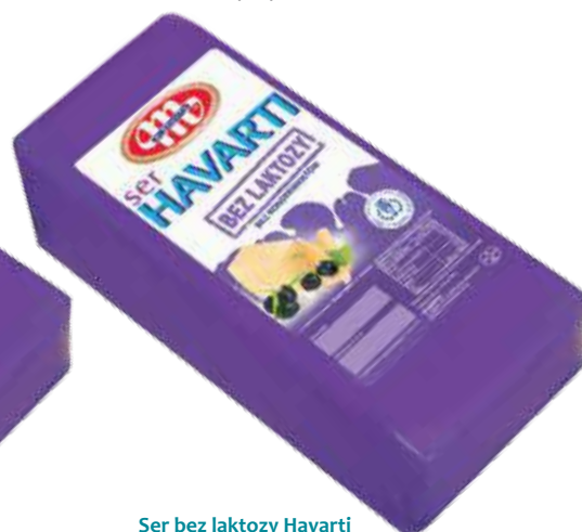
Ser bez laktozy Havarti Havarti cheese lactose free Сыр без лактозы Хаварти Kod wagowy lub cenowy Code weight or price Код весовой или ценовой 04069076