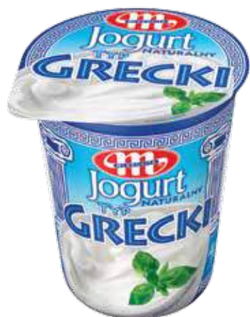
Jogurt naturalny typ grecki 400 g Natural yoghurt greek type 400 g Греческий натуральный йогурт 400 г