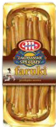
FARUKI wędzone, ser parzony, niedojrzewający, 100 g FARUKI snack cheese smoked 100 g ФАРУКИ закусочный сыр копченый 100 г 5900512950013 5900512991573 04069099