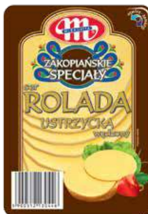
Ser Rolada Ustrzycka wędzona 150 g Rolada Ustrzycka smoked cheese 150 g Сыр копченый Рулет Устрицкий 150 г