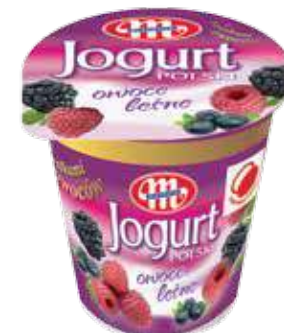
Jogurt POLSKI owoce leśne 150 g Forest fruits yoghurt 150 g Йогурт лесные ягоды 150 г