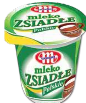
Mleko zsiadłe POLSKIE 370 g Curdled milk 370 g Простокваша 370 г