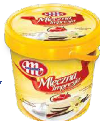
Mleczna Impresja Serek o smaku waniliowym 1 kg Vanilla soft cheese 1 kg Сырок с ванильным ароматом 1 кг