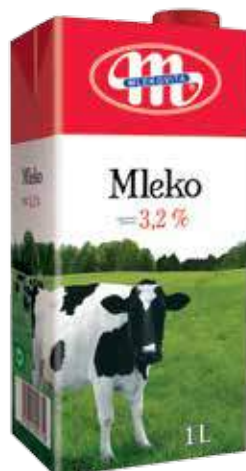
Mleko UHT 3,2% tł. 1 L UHT Milk 3,2% fat 1 L Молоко УВТ 3,2% жира 1 л 5901062002719 5901062102686 04012091