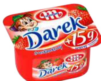
Serek homogenizowany Darek truskawkowy 150 g Darek strawberry soft cheese 150 g Гомогенизированный сырок Дарэк клубничный 150 г