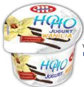
Jogurt HOHO wanilia 100 g Vanilla yoghurt HOHO 100 g Йогурт ХОХО ваниль 100 г