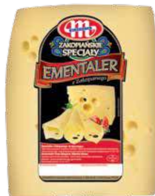
Ser Ementaler z Zakopanego Ementaler z Zakopanego cheese Сыр Эмменталер из Закопане

Kod wagowy lub cenowy Code weight or price Код весовой или ценовой 04069013