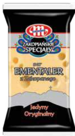
Ser Ementaler z Zakopanego - kawałek 250 g Ementaler z Zakopanego cheese - pieces 250 g Сыр Эмменталер из Закопане - кусок 250 г