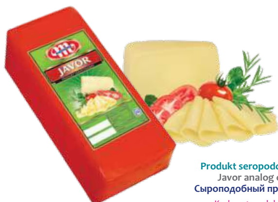
Produkt seropodobny Javor Javor analog cheese Сыроподобный продукт Явор

Kod wagowy lub cenowy Code weight or price Код весовой или ценовой