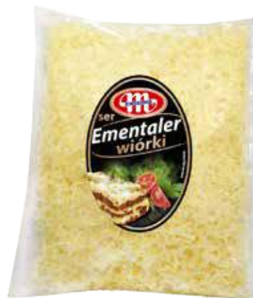
Ser Emmentaler wiórki

Emmentaler desiccated cheese Эменталер сыр измельченный