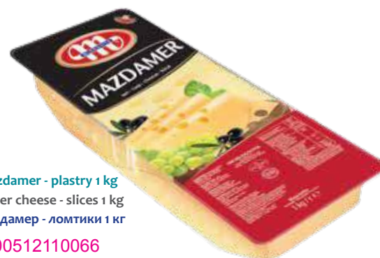
Ser Mazdamer - plastry 1 kg Mazdamer cheese - slices 1 kg Сыр Маздамер - ломтики 1 кг