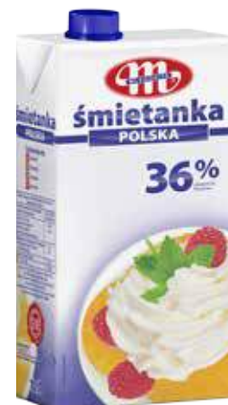
Śmietanka UHT POLSKA 36% tł. 1 L