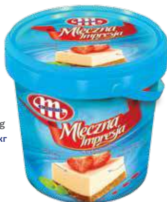
Mleczna Impresja Serek naturalny 1 kg Natural soft cheese 1 kg Натуральный сырок 1 кг