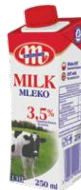
Mleko UHT 3,5% tł., 250 ml UHT Milk 3,5% fat, 250 ml Молоко УВТ 3,5% жира, 250 мл 5900512999968 5900512992983 04012091