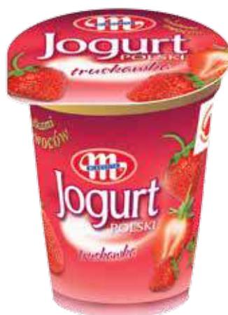
Jogurt POLSKI truskawka 350 g Strawberry yoghurt 350 g Йогурт клубника 350 г