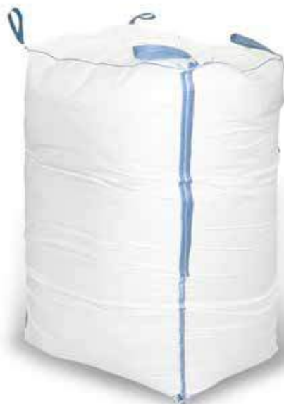
BIG BAG ok. 1000 kg BIG BAG approximately 1000 kg БИГ-БЭГ около 1000 кг