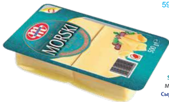
Ser Morski - plastry 500 g Morski cheese - slices 500 g Сыр Морской - ломтики 500 г