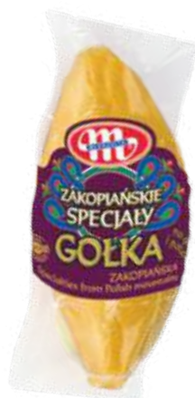
Ser Gołka Zakopiańska wędzona 500 g Gołka Zakopiańska smoked cheese 500 g Сыр Голка Закопанская копченая 500 г 5900512900186 5900512900179 04069099