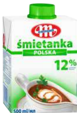
Śmietanka UHT POLSKA 12% tł. 500 ml