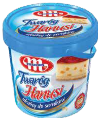
Twaróg sernikowy Hanusi 6,5% tł. 1 kg Hanusi - cottage full-fat cheese for cheesecakes 6,5% fat 1 kg Творог для сырников Хануси 6,5% жира 1 кг