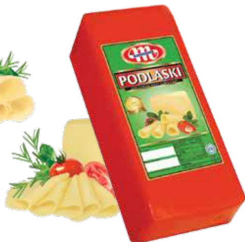
Ser Podlaski Podlaski cheese Сыр Подляский

Kod wagowy lub cenowy Code weight or price Код весовой или ценовой