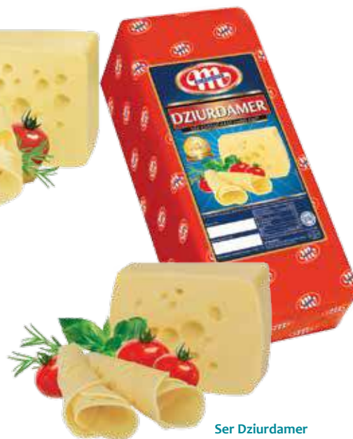
Ser Dziurdamer Dziurdamer cheese Сыр Джюрдамер Kod wagowy lub cenowy Code weight or price Код весовой или ценовой