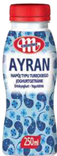
AYRAN napój typu tureckiego 250 ml Drink type of Turkish AYRAN 250 ml AYRAN Напиток тип Турецкий 250 мл

AYRAN is a drink based on the original Turkish recipe – prepared on yoghurt, water and salt. Extremely popular in the Middle East countries, but it is becoming more and more popular in Europe as well. It is refreshing and quenches thirst. Ideally fitted for kebab, pancakes, grilled dishes and roasted new potatoes. However, it harmonizes well with the flavors of dill, garlic, pepper, chives and fresh mint.