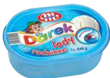
Lody rodzinne śmietankowe 1 L Family creamy ice cream 1 L Сливочное семейное мороженое 1 Л