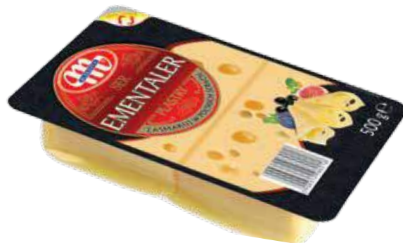
Ser Ementaler - plastry 500 g Ementaler cheese - slices 500 g Сыр Эменталер - ломтики 500 г