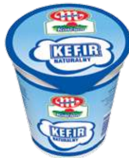
Kefir naturalny 200 g Natural kefir 200 g Кефир натуральный 200 г