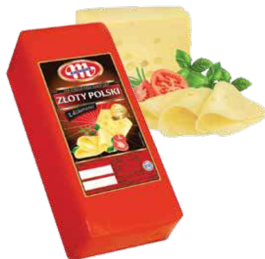
Ser Złoty Polski z dziurami Złoty Polski with holes cheese Сыр Польский золотой с дырками

Kod wagowy lub cenowy Code weight or price Код весовой или ценовой