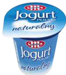
Jogurt POLSKI naturalny 150 g Natural yoghurt 150 g Натуральный йогурт 150 г