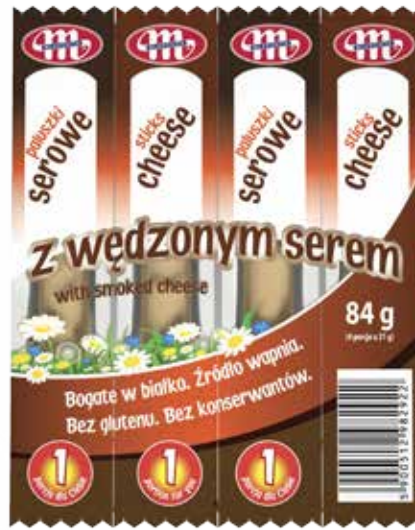
Paluszki serowe z wędzonym serem 84 g Cheese sticks with smoked cheese 84 g Сырные палочки с копченым сыром 84 г