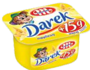
Serek homogenizowany Darek waniliowy 150 g Darek vanilla soft cheese 150 g Гомогенизированный сырок Дарэк ванильный 150 г

Homogenized cheeses / Гомогенизированные сырки