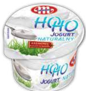
Jogurt HOHO naturalny 100 g Natural yoghurt HOHO 100 g Натуральный йогурт ХОХО 100 г