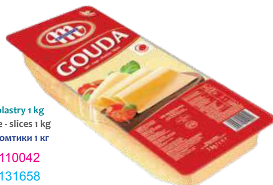
Ser Gouda - plastry 1 kg GOUDA cheese - slices 1 kg Сыр Гауда - ломтики 1 кг