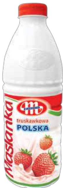
Maślanka truskawkowa POLSKA 1 kg Strawberry buttermilk 1 kg Пахта клубничная 1 кг