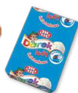
Lody kostka 225 ml Ice cream 225 ml Мороженое брикет 225 мл