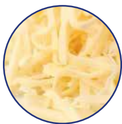
WIÓRKI 2,4 mm