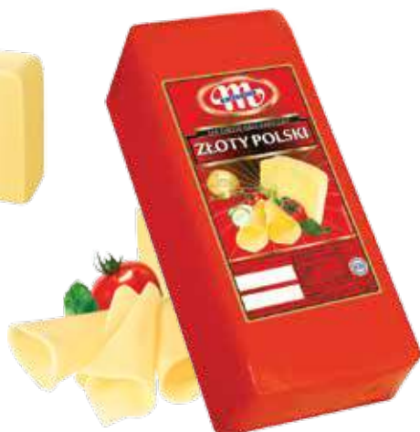
Ser Złoty Polski Złoty Polski cheese Сыр Польский золотой

Kod wagowy lub cenowy Code weight or price Код весовой или ценовой