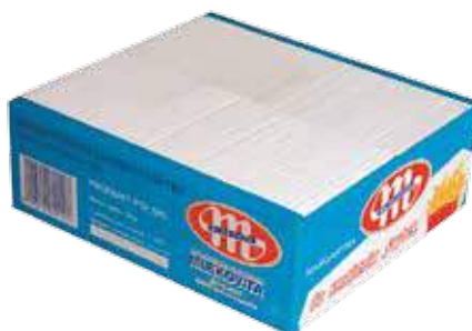
Tłuszcz roślinny do smażenia frytek 5 kg Vegetable fat to fry french fries 5 kg Жир растительный для картофеля фри 5 кг