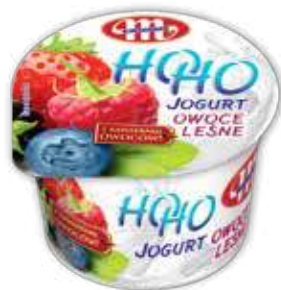
Jogurt HOHO owoce leśne 100 g Forest fruits yoghurt HOHO 100 g Йогурт ХОХО лесные ягоды 100 г