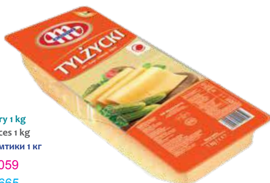
Ser Tylżycki - plastry 1 kg Tylżycki cheese - slices 1 kg Сыр Тылъжикский - ломтики 1 кг