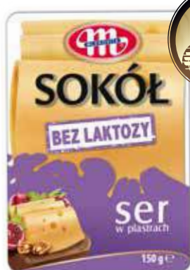
Ser bez laktozy Sokół 150 g Sokół cheese lactose free 150 g Сыр без лактозы Сокол 150 g 5900512999821 5900512992945 04069089