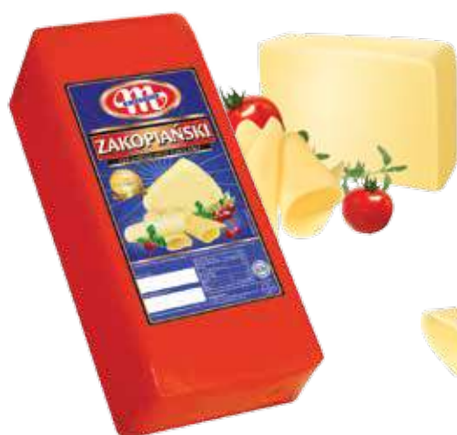
Ser Zakopiański Zakopiański cheese Сыр Закопанский

Kod wagowy lub cenowy Code weight or price Код весовой или ценовой