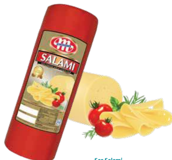
Ser Salami Salami cheese Сыр Салами

Kod wagowy lub cenowy Code weight or price Код весовой или ценовой