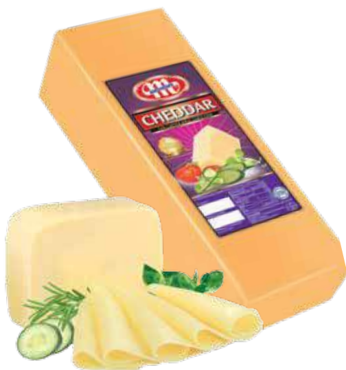
Ser Cheddar Cheddar cheese Сыр Чеддер

Kod wagowy lub cenowy Code weight or price Код весовой или ценовой