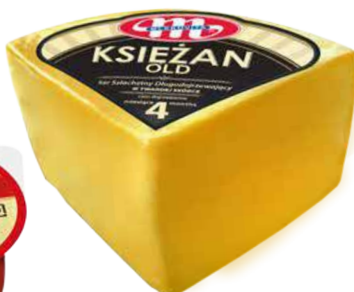
Ser KSIEŻAN OLD KSIEŻAN OLD cheese Сыр КСЕНЖАН ОЛЬД