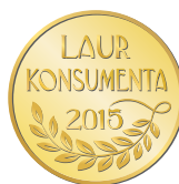
Złoty Laur Konsumenta 2015 - kategoria masła