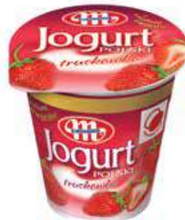
Jogurt POLSKI truskawka 150 g Strawberry yoghurt 150 g Йогурт клубника 150 г