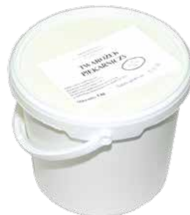
Twarożek Piekarniczy 5 kg Cottage cheese for baking 5 kg Творог для кулинарии 5 кг