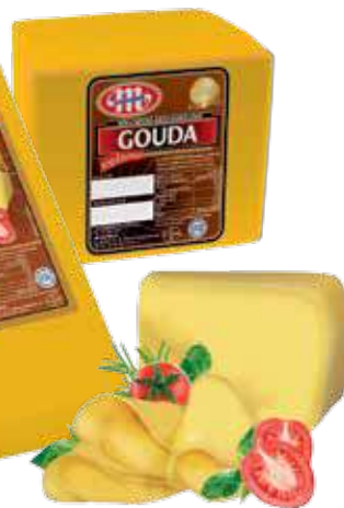
Ser Mini Gouda wędzona Mini Gouda smoked cheese Сыр Мини Гауда копченая

Kod wagowy lub cenowy Code weight or price Код весовой или ценовой