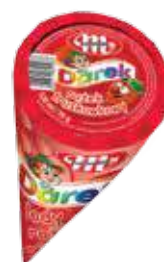
Rożki o smaku truskawkowym 120 ml Strawberry ice cream cones 120 ml Клубничный рожок 120 мл