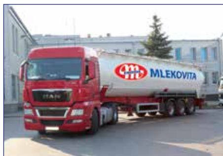
Cysterna do przewozu mleka i serwatki w proszku Tanker for the transport of milk and whey powder

Storage conditions: temperature below 25°C and humidity of max. 75%.