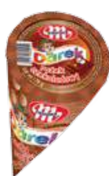
Rożki czekoladowe 120 ml Chocolate ice cream cones 120 ml Шоколадный рожок 120 мл