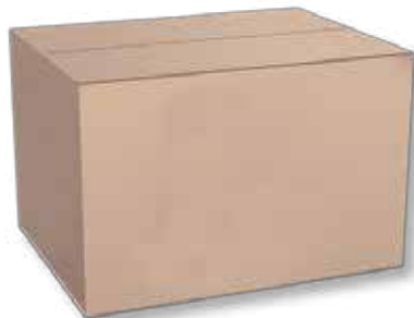
Bezwodny tłuszcz mleczny - masło klarowane 25 kg Anhydrous milk fat - rendered butter 25 kg Безводный молочный жир - топленое сливочное масло 25 кг