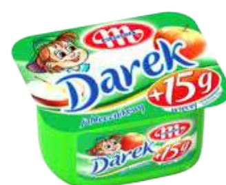
Serek homogenizowany Darek jabłecznikowy 150 g Darek apple soft cheese 150 g Гомогенизированный сырок Дарэк яблочный 150 г