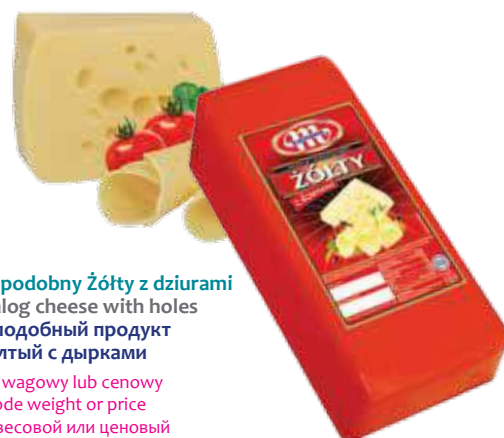
Produkt seropodobny Żółty z dziurami Żółty analog cheese with holes Сыроподобный продукт Желтый с дырками

Kod wagowy lub cenowy Code weight or price Код весовой или ценовой