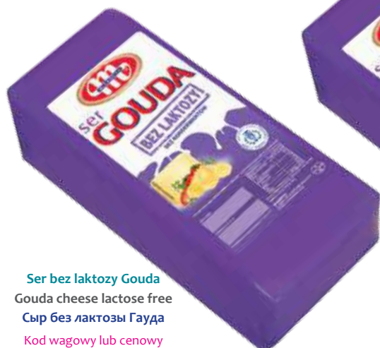
Ser bez laktozy Gouda Gouda cheese lactose free Сыр без лактозы Гауда Kod wagowy lub cenowy Code weight or price Код весовой или ценовой 04069078

Many people suffer from lactose intolerance - disaccharide naturally occurring in milk. Usually they give up eating dairy products, sacrificing valuable nutrients needed for the proper functioning of the body. The reason is the absence or deficiency of the lactase - digestive enzyme needed to break down lactose to absorbable sugars, glucose and galactose. MLEKOVITA to face the nutritional needs of those consumers, has prepared a line of cheese without lactose.