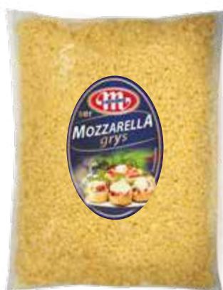
Ser Mozzarella grys

1 kg/kr 5900512900278 5900512960142 04062000