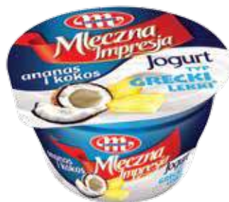
Jogurt Mleczna Impresja ananas i kokos 150 g Pineapple and coconut yoghurt 150 g Йогурт ананас и кокос 150 г