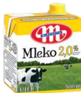
Mleko UHT 2,0% tł. 500 ml UHT Milk 2,0% fat 500 ml Молоко УВТ 2,0% жира 500 мл 5900512990439 5900512991429 04012011