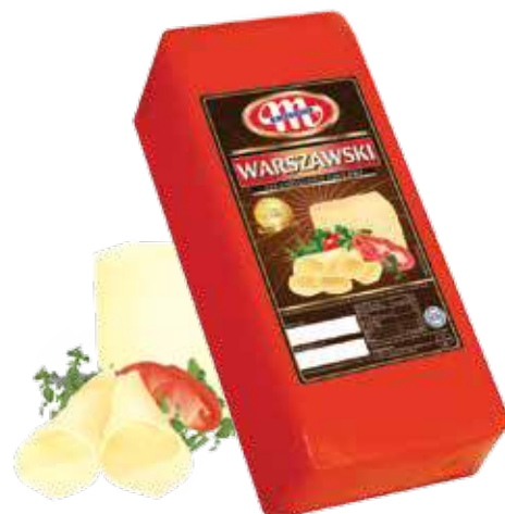
Ser Warszawski Warszawski cheese Сыр Варшавский

Kod wagowy lub cenowy Code weight or price Код весовой или ценовой