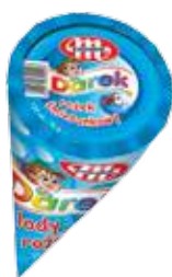
Rożki śmietankowe 120 ml Creamy ice cream cones 120 ml Сливочный рожок 120 мл