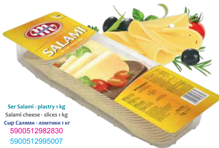
Ser Salami - plastry 1 kg Salami cheese - slices 1 kg Сыр Салами - ломтики 1 кг