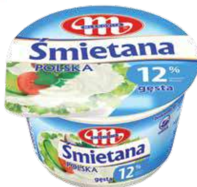
Śmietana POLSKA 12% tł. 200 g Sour cream 12% fat 200 g Сметана 12% жира 200 г 5900512350011 5900512351018 04039059