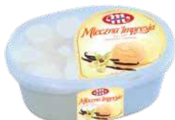
Lody Mleczna Impresja o smaku śmietankowo-waniliowym 1 L Mleczna Impresja flavour cream-vanilla ice cream 1 L Мороженое сливочно-ванильное 1 Л