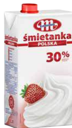
Śmietanka UHT POLSKA 30% tł. 1 L