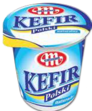
Kefir POLSKI naturalny 400 g Natural kefir 400 g Кефир натуральный 400 г

Kefir, curdled milk / Кефир, простокваша