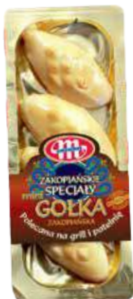
Ser Mini Gołka Zakopiańska wędzona 160 g Mini Gołka Zakopiańska smoked cheese 160 g Сыр Мини Голка Закопанская копченая 160 г 5900512990552 5900512991559 04069099