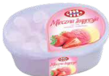
Lody Mleczna Impresja o smaku śmietankowo-truskawkowym 1 L Mleczna Impresja flavour cream-strawberry ice cream 1 L Мороженое сливочно-клубничное 1 Л