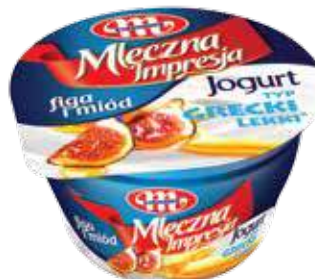
Jogurt Mleczna Impresja figa i miód 150 g Fig and honey yoghurt 150 g Йогурт инжир и мед 150 г