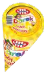
Rożki o smaku waniliowym 120 ml Vanilla ice cream cones 120 ml Ванильный рожок 120 мл