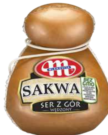
Ser Sakwa z gór, wędzony 300 g Cheese Sakwa from the mountains, smoked 300 g Саква сыр с гор, копченый 300 г