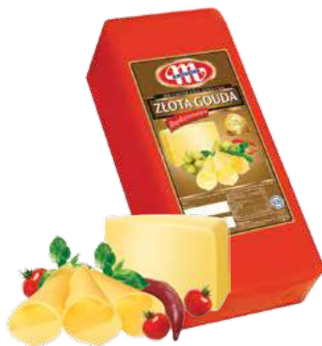
Ser Złota Gouda Złota Gouda cheese Сыр Золотая Гауда

Kod wagowy lub cenowy Code weight or price Код весовой или ценовой