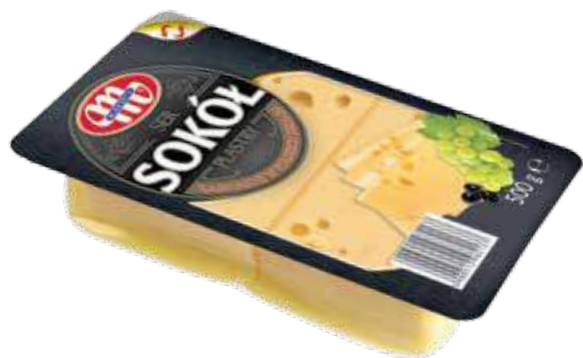
Ser Sokół - plastry 500 g Sokół cheese - slices 500 g Сыр Сокол - ломтики 500 г