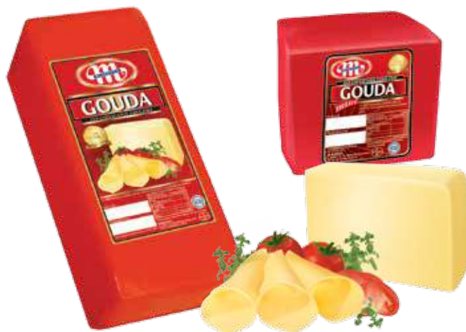
Ser Gouda Gouda cheese Сыр Гауда

Dutch type cheeses / Сыры голландского типа