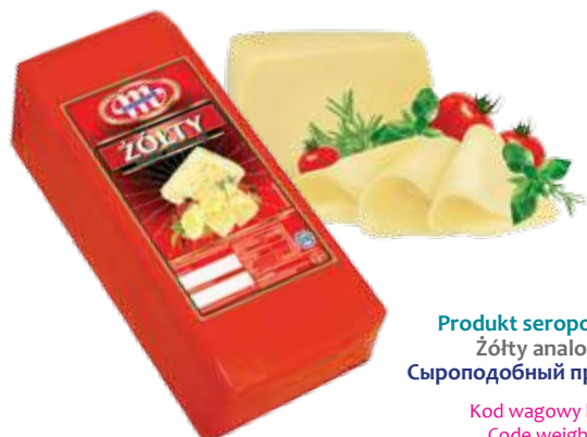
Produkt seropodobny Żółty Żółty analog cheese Сыроподобный продукт Желтый

Kod wagowy lub cenowy Code weight or price Код весовой или ценовой