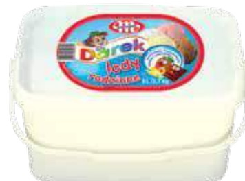
Lody śmietankowo-truskawkowo- waniliowo-czekoladowe 5 L Creamy-strawberry- vanilla-chocolate ice cream 5 L Мороженое сливочно-клубнично- ванильно-шоколадное 5 Л