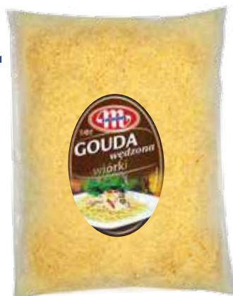
Ser Gouda wędzona wiórki

1 kg/kr 5900512110950 5900512132143 04062000 2 kg/kr 5900512110967 5900512132150 04062000