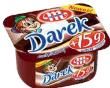
Serek homogenizowany Darek czekoladowy 150 g Darek chocolate soft cheese 150 g Гомогенизированный сырок Дарэк шоколадный 150 г