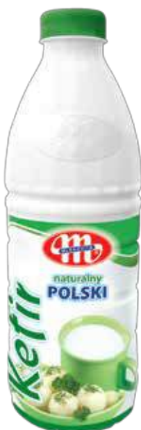
Kefir POLSKI naturalny 1 kg Natural kefir 1 kg Кефир натуральный 1 кг