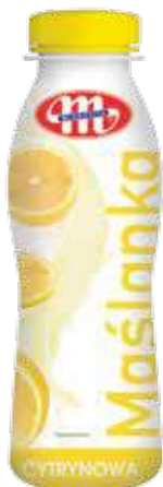
Maślanka cytrynowa 400 g Lemon buttermilk 400 g Пахта лимонная 400 г