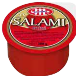
Ser Salami Mini 300 g Salami Mini cheese 300 g Сыр Салами Мини 300 г