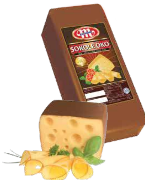
Ser Sokole Oko Sokole Oko cheese Сыр Соколинный глаз Kod wagowy lub cenowy Code weight or price Код весовой или ценовой