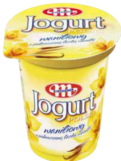
Jogurt POLSKI waniliowy 350 g Peach with passionfruit yoghurt 350 g Йогурт персик и маракуя 350 г