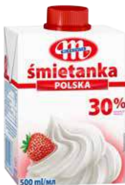
Śmietanka UHT POLSKA 30% tł. 500 ml