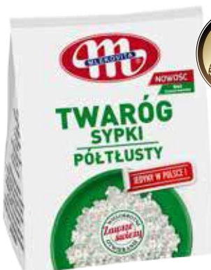
Twaróg sypki półtłusty 500 g Semi-skimmed cottage grainy cheese 500 g Творог зернистый полужирный 500 г