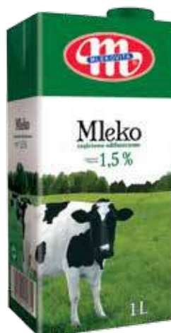
Mleko UHT 1,5% tł. 1 L UHT Milk 1,5% fat 1 L Молоко УВТ 1,5% жира 1 л 5901062002702 5901062102679 04012011