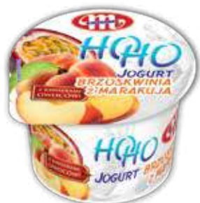
Jogurt HOHO brzoskwinia z marakują 100 g Peach with passionfruit yoghurt HOHO 100 g Йогурт ХОХО персик и маракую 100 г