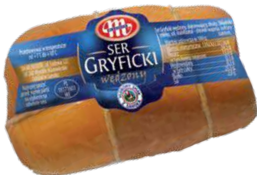
Ser Gryficki wędzony 400 g Gryficki smoked cheese 400 g Сыр Грыфицкий копченый 400 г