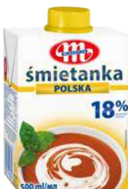
Śmietanka UHT POLSKA 18% tł. 500 ml