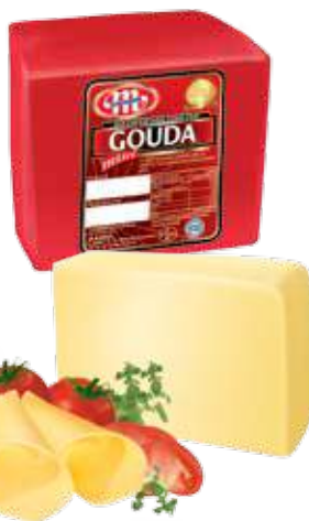
Ser Mini Gouda Mini Gouda cheese Сыр Мини Гауда

Kod wagowy lub cenowy Code weight or price Код весовой или ценовой