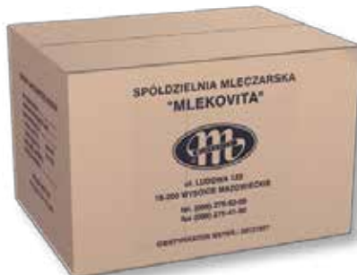
Masło Ekstra blok 25 kg Extra butter block 25 kg Сливочное масло экстра блок 25 кг