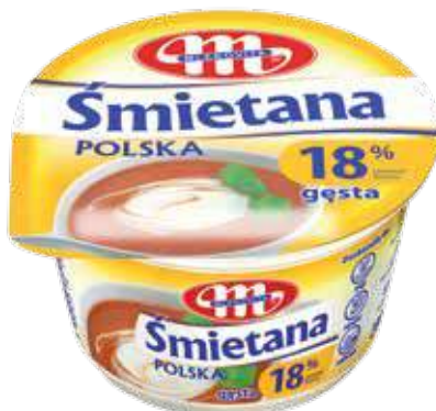
Śmietana POLSKA 18% tł. 200 g Sour cream 18% fat 200 g Сметана 18% жира 200 г 5900512350035 5900512351025 04039059