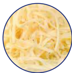
WIÓRKI 1,5 mm

Grated Cheese: desiccated, cube / Тертый сыр: измельченный, нарезанный кубиками