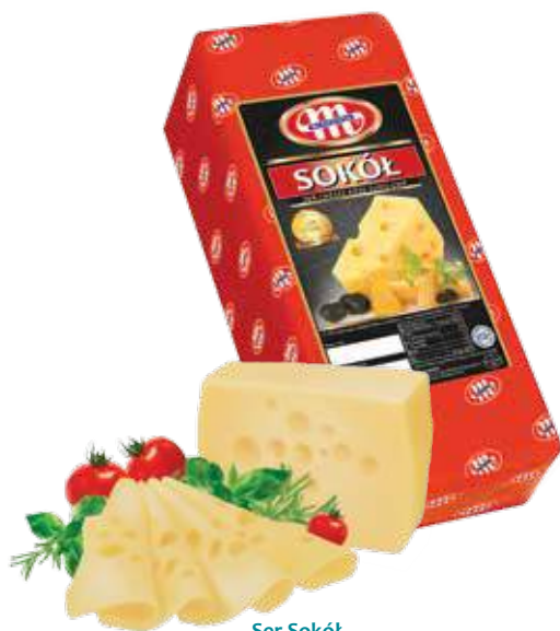
Ser Sokół Sokół cheese Сыр Сокол Kod wagowy lub cenowy Code weight or price Код весовой или ценовой