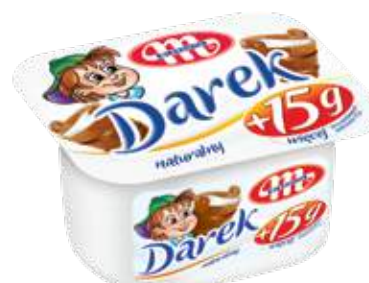
Serek homogenizowany Darek naturalny 150 g Darek natural soft cheese 150 g Гомогенизированный сырок Дарэк натуральный 150 г