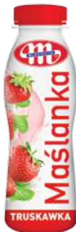
Maślanka truskawkowa 400 g Strawberry buttermilk 400 g Пахта клубничная 400 г