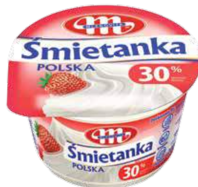
Śmietanka POLSKA 30% tł. 200 ml Cream 30% fat 200 ml Сливки 30% жира 200 мл 5900512350059 5900512351056 04022191

Mleko spożywcze 3,2%; 2% tł. Milk 3,2%; 2% fat Молоко 3,2%; 2% жира