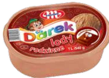
Lody rodzinne czekoladowe 1 L Family chocolate ice cream 1 L Шоколадное семейное мороженое 1 Л