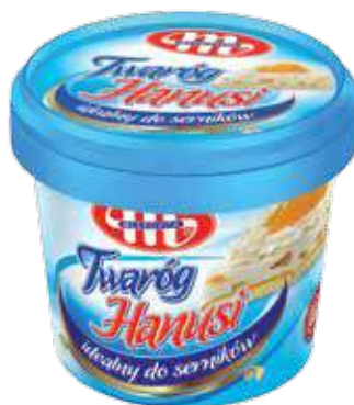
Twaróg sernikowy Hanusi 6,5% tł. 500 g Hanusi - cottage full-fat cheese for cheesecakes 6,5% fat 500 g Творог для сырников Хануси 6,5% жира 500 г