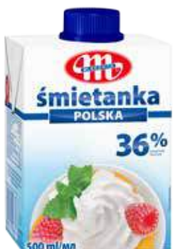
Śmietanka UHT POLSKA 36% tł. 500 ml