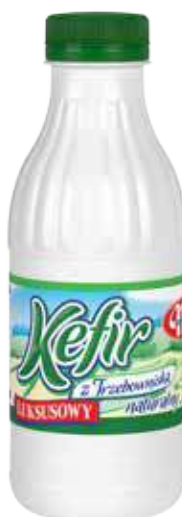
Kefir luksusowy naturalny 375 g Luxurious natural kefir 375 g Кефир роскошный натуральный 375 г