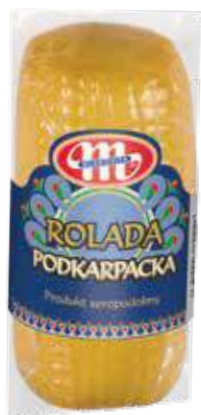
Produkt seropodobny Rolada Podkarpacka wędzona 300 g Rolada Podkarpacka vegetable fat 300 g Сыроподобный продукт Рулет Подкарпатский 300 г

Kod wagowy lub cenowy Code weight or price Код весовой или ценовой 04069013