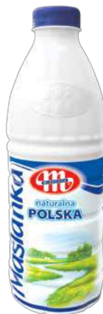
Maślanka naturalna POLSKA 1 kg Natural buttermilk 1 kg Пахта натуральная 1 кг