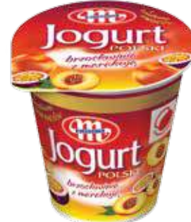
Jogurt POLSKI brzoskwinia z marakują 150 g Peach with passionfruit yoghurt 150 g Йогурт персик и маракуя 150 г