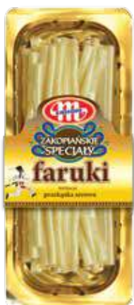
FARUKI, ser parzony, niedojrzewający, 100 g FARUKI snack cheese 100 g ФАРУКИ закусочный сыр 100 г 5900512950020 5900512991566 04069099