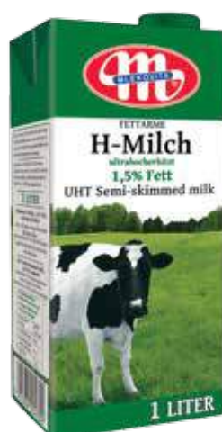
Mleko UHT 1,5% tł. 1 L UHT Milk 1,5% fat 1 L Молоко УВТ 1,5% жира 1 л 5901062002702 04012011