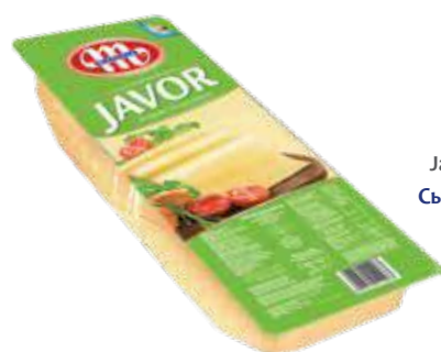
Produkt seropodobny Javor plastry 1 kg Javor analog cheese - slices 1 kg Сыроподобный продукт Явор - ломтики 1 кг