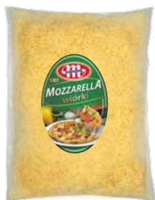
Ser Mozzarella wiórki

Mozzarella desiccated cheese Моцарелла сыр измельченный