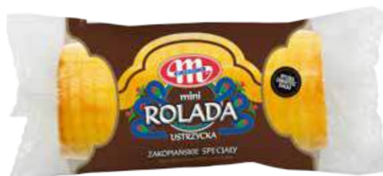
Ser Mini Rolada Ustrzycka 300 g Mini Rolada Ustrzycka smoked cheese 300 g Сыр Мини Рулет Устрицкий 300 г 5900512900193 5900512910192 04069089