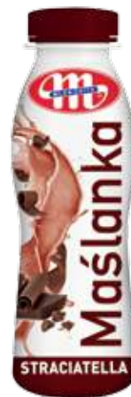
Maślanka stracciatella 400 g Stracciatella buttermilk 400 g Пахта страчателла 400 г