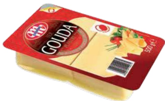
Ser Gouda - plastry 500 g GOUDA cheese - slices 500 g Сыр Гауда - ломтики 500 г