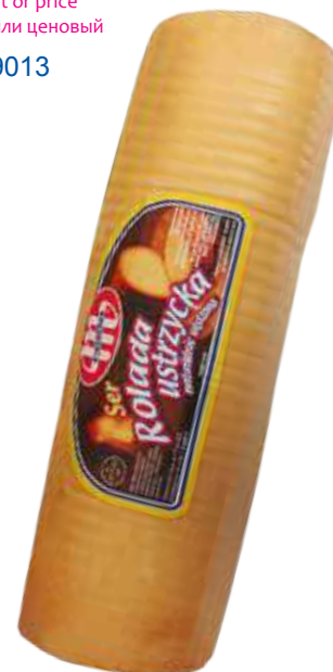
Ser Rolada Ustrzycka wędzona Rolada Ustrzycka smoked cheese Копченый сыр Рулет Устрицкий

Kod wagowy lub cenowy Code weight or price Код весовой или ценовой 04069089