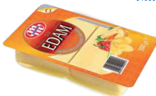
Ser Edam - plastry 500 g Edam cheese - slices 500 g Сыр Эдам - ломтики 500 г