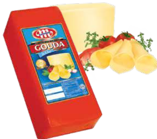
Ser Gouda lekka Gouda light cheese Сыр Гауда легкий

Kod wagowy lub cenowy Code weight or price Код весовой или ценовой