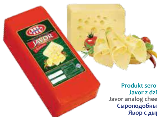
Produkt seropodobny Javor z dziurami Javor analog cheese with holes Сыроподобный продукт Явор с дырками

Kod wagowy lub cenowy Code weight or price Код весовой или ценовой