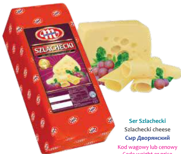
Ser Szlachecki Szlachecki cheese Сыр Дворянский Kod wagowy lub cenowy Code weight or price Код весовой или ценовой