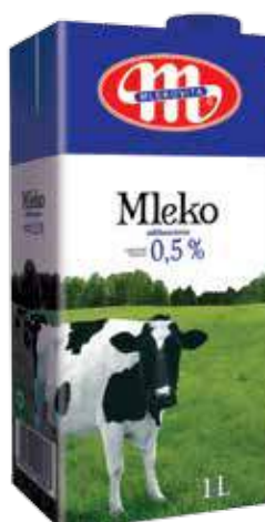
Mleko UHT 0,5% tł. 1 L UHT Milk 0,5% fat 1 L Молоко УВТ 0,5% жира 1 л 5901062000807 5901062100804 04011010